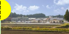
特別養護老人ホーム陽ノ丘荘