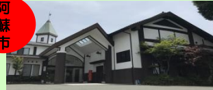
特別養護老人ホームあそん里