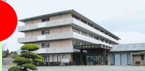
大阿蘇病院（介護療養病床、地域密着型介護施設）