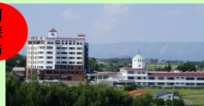
介護老人保健施設阿蘇グリーンヒル