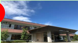
特別養護老人ホーム乙姫荘