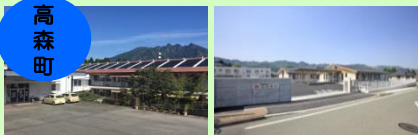
特別養護老人ホーム梅香苑 特別養護老人ホームひめゆり