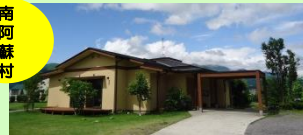
グループホームみなみ阿蘇ケアサービス