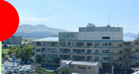
介護老人保健施設愛・ライフ内牧